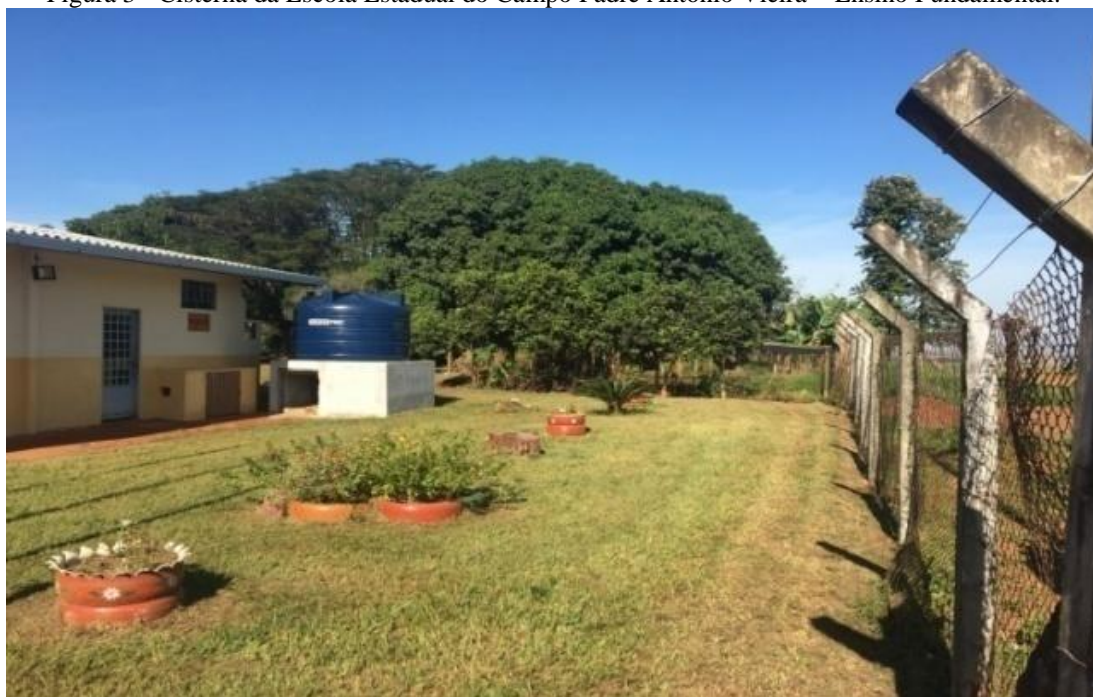
Figura 3 - Cisterna da Escola Estadual do Campo Padre Antônio Vieira – Ensino Fundamental.

água da chuva (Figura 3), lixeiras para coleta seletiva, além da realização de adequações na jardinagem.