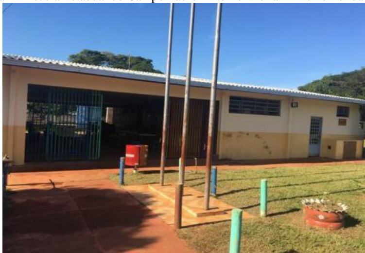
Figura 1 - Escola Estadual do Campo Padre Antônio Vieira – Ensino Fundamental.

Este estudo foi realizado na Escola Estadual Padre Antônio Vieira – Ensino Fundamental (Figura 1), que funciona no período vespertino, em prédio próprio, em dualidade com a Escola Municipal Glória Xavier de Mendonça – Ensino Fundamental I, a qual atende os alunos de 1º ao 5º ano, no período matutino. O espaço conta com cinco salas de aula, uma sala de secretaria, uma sala de direção, uma sala de almoxarifado, uma sala de professores, quatro banheiros, uma sala multiuso (laboratório de informática e sala de hora atividade dos professores), uma quadra de esportes, uma cozinha e um refeitório.