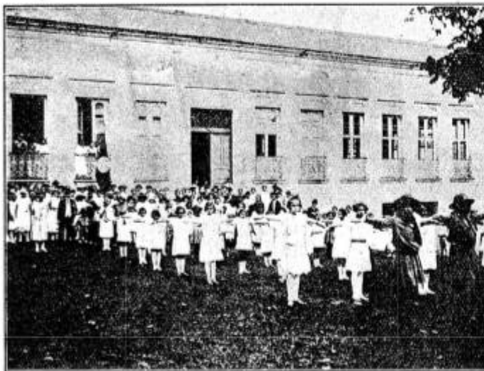
Gymnástica sueca no Grupo Escolar de Baturité, interior do Ceará, inaugurado oficialmente a 25 de Março deste anno. Como o Grupo de Baturité estão funcionando doze outros no sertão.

A relevância que a educação física alcançou estava estampada nas ações do professor Lourenço Filho e no artigo publicado no impresso pedagógico