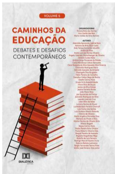
Figura 1 – Capa do livro “Caminhos da Educação: Debates e desafios contemporâneos – Volume 5”.

SANTOS, Viviane Brás dos; REIS, Ana Cecília dos; BARRETO, Maria Iraídes da Silva (orgs.). Caminhos da Educação: Debates e desafios contemporâneos – Volume 5. São Paulo: Dialética, 2023. 540p. ISBN 978-65-252-7510-9. Disponível em: < https://drive.google.com/file/d/1EzGogaOx8nAg9nTy3VA76_ivWFnm_T8b/view?usp=ssharing >. Acesso em 10 dez. 2024.